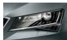
Smart Light Assist - automatické přepínání a clonění dálkových světel