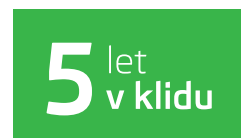
Předplacený servis na 5 let / 100 000 km při financování od ŠKODA Finance